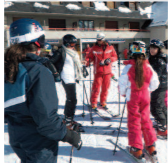
Olympiades, voyage au ski, sortie canoë-kayak... : l'occasion de se confronter à d'autres challenges, de vivre en groupe et de s'exercer au sport.