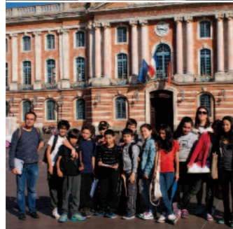
Visite de Toulouse : découverte de la ville avec des enseignements uniques sur le terrain